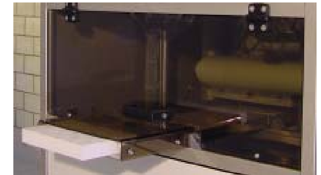
Der flache und horizontale Trockeneis-Ausgang minimiert Trockeneisverluste.