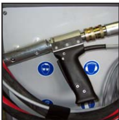
Aufhängung für Pistole