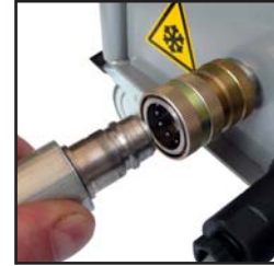
Schnellkupplung am Strahlschlauch