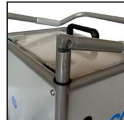
Einklappbarer Griff für einfachen Transport