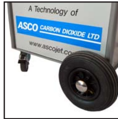
Einfach und bequem zu manövrieren