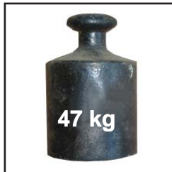
Sehr leicht und kompakt