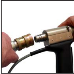
Leistungsstarke und handliche Strahlpistole mit Schnellkupplung