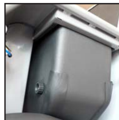
Isolierter Trockeneisbehälter mit einer Kapazität von 9 kg