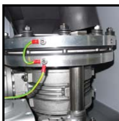
Verteilereinheit für pulsationsfreies Strahlen