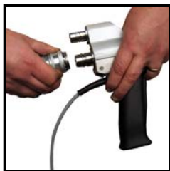
Leistungsstarke Strahlpistole mit Sicherheitsschnellkupplung