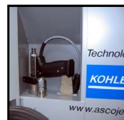
Seitenkasten für Pistole, Düsen und Werkzeug