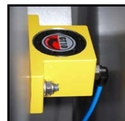
Optimaler Pelletfluss dank wartungsfreiem Luftvibrator