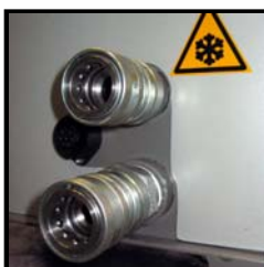
Zweischlauchsystem für maximale Leistung