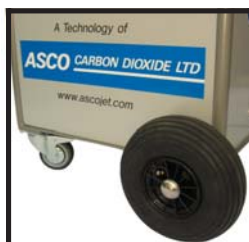
Einfach und bequem zu manövrieren