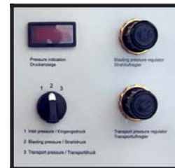
Separate Regelung für Strahl- und Transportdruck